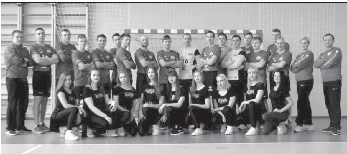
Nuotraukoje – Zarasų rankinio komanda „Kiras“.

Vienybė – tai lyg draugas, su kuriuo būdamas jauti saugumą, palaikymą, užuojautą, kuris priverčia tave šypsotis ir kiekvieną dieną jaustis vis stipresniam. Žmogui visada reikia žmogaus. Visada gera turėti tą, iš kurio gali pasimokyti, visada gera žinoti, kad aplink tave yra gausus būrys tuo pačiu oru kvėpuojančių žmonių. Kartais mums nusvira rankos, nesiseka, bet šalia yra žmonės, kurie tiki ir stumia mus į priekį – tai ir yra vienybės esmė. Mes galime vieni kitiems įžeipti viltį, tikėjimą, pasitikėjimą, mes vieni kitus auginame. Kartais net nesuvokiame, kokie esame reikalingi vienas kitam, todėl nebijokime to pripažinti, juk visada smagu išgirsti gerą žodį, bet patikėkite – mokėti jį ištartį yra dar smagiau!